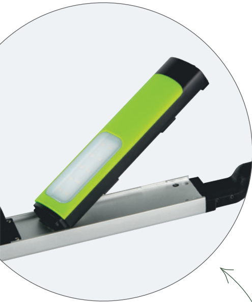
ZUSATZLICHT AUXILIARY LIGHT