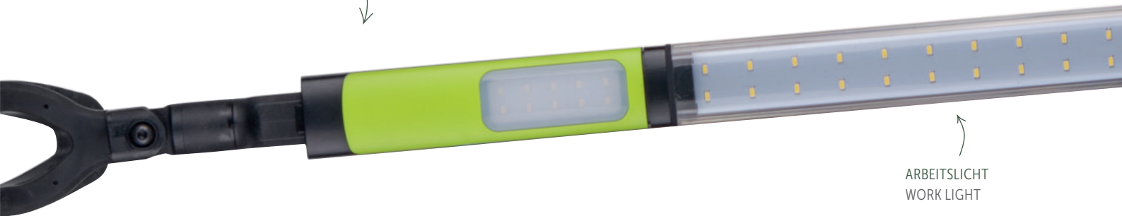
ARBEITSLICHT WORK LIGHT